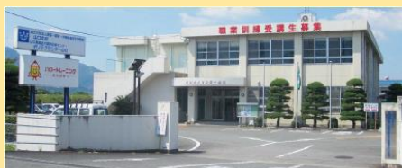
ポリテクセンター山口