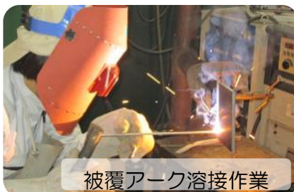
被覆アーク溶接作業