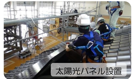
太陽光パネル設置