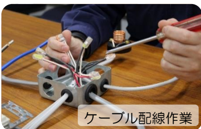
ケーブル配線作業