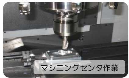
マシニングセンタ作業