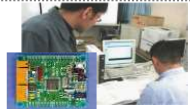
マイコン制御プログラミング

制御のためのマイコン活用法、ソフトウェア設計法を習得します。 (C言語、制御のためのコンピュータソフトウェア、パラレルI/O、シリアルI/O、カウンタ・タイマプログラミング、A/D変換、D/A変換、組み込み用コンピュータ概要)