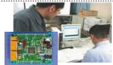
マイコン制御プログラミング

制御のためのマイコン活用法、ソフトウェア設計法を習得します。 (C言語、制御のためのコンピュータソフトウェア、パラレルI/O、シリアルI/O、カウンタ・タイマプログラミング、A/D変換、D/A変換、組み込み用コンピュータ概要)