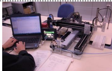
サーボモータによる位置決め制御