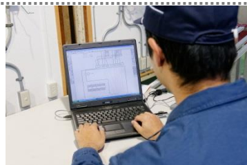
電気配線図の作成