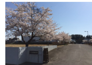
アズビル金門青森株式会社

所在地 : 青森市 業種 : 水道メーターの製造 利用コース: 品質管理実践 実施時期 : 平成29年10月