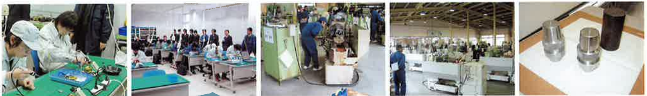
【2012 P Vin 岡山、ものづくりコンテスト（学生参加）】