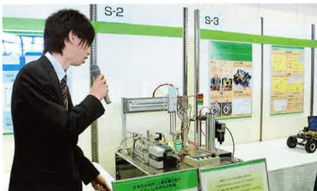
【研究発表の部：ポスターセッション】