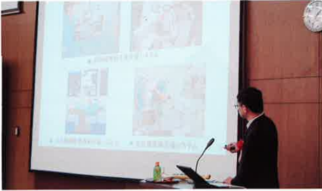
【手術ロボットの現状と将来展望】