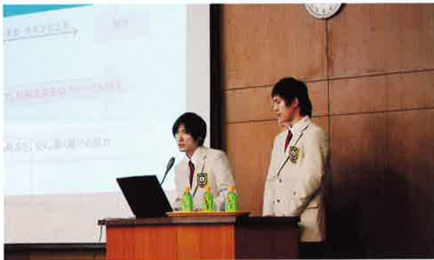
【技能五輪世界一への挑戦】