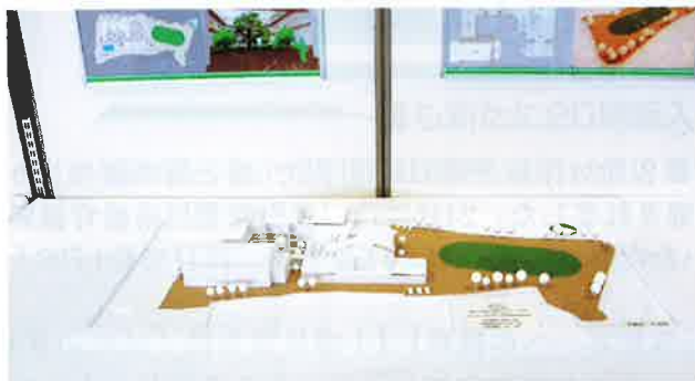
【小学校の設計 ～現在の問題を建築でサポートする～】 【ポリテクカレッジ島根展示作品】