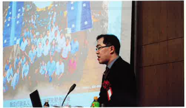
【小惑星探査機「はやぶさ」の挑戦】