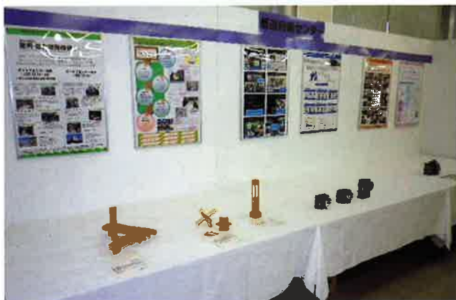
【機構島根センター等の展示】