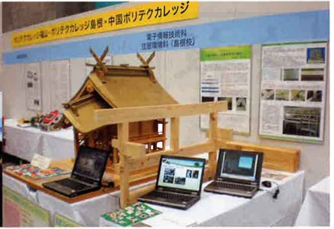
【展示・体験の部：ふくやま産業交流館(ビッグ・ローズ)じばさんフェア2010】