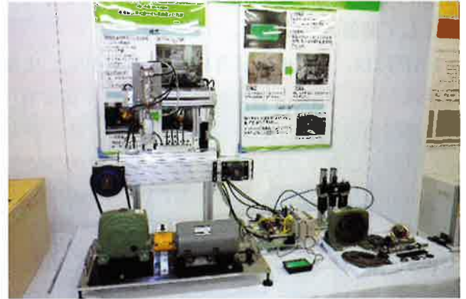
【ポリテクカレッジ島根展示】