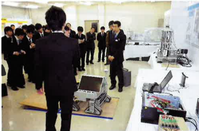
【研究発表の部：ポスターセッション】