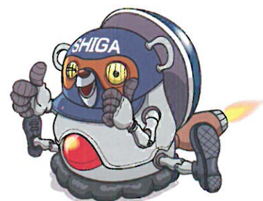
マスコットキャラクター シガボン