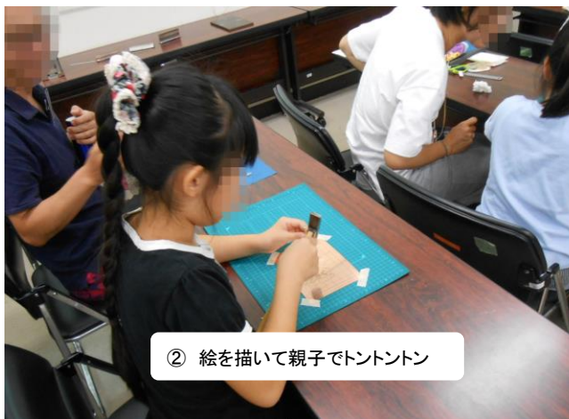
② 絵を描いて親子でトントントン