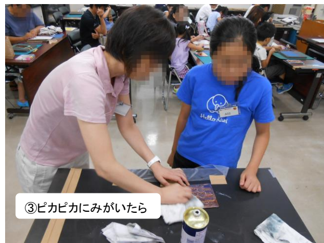
③ピカピカにみがいたら