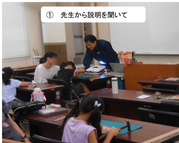
① 先生から説明を聞いて