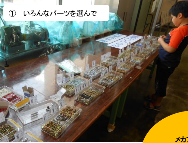
① いろんなパーツを選んで