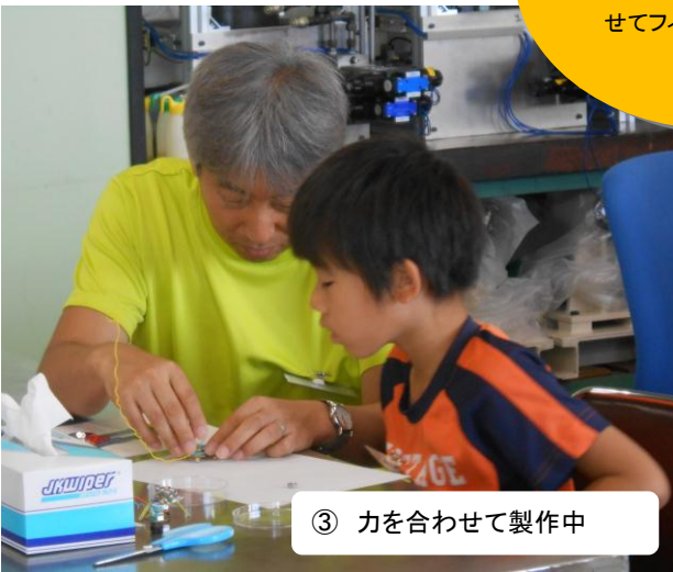
③ 力を合わせて製作中