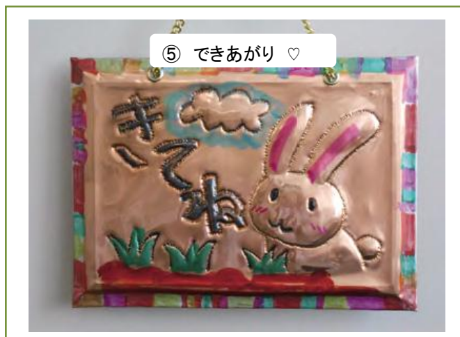
⑤ できあがり ♡