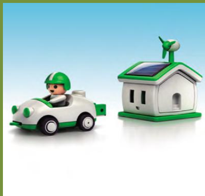
① 部品を組み立てて