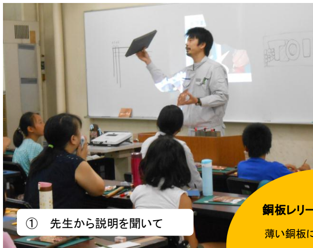
① 先生から説明を聞いて

8月6日(土) 夏休みの親子45組90名の方に「ものづくり」の楽しさを体験していただきました。一部ですが、写真で教室の様子をご紹介します。