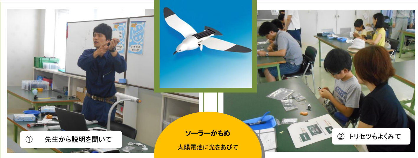
① 先生から説明を聞いて