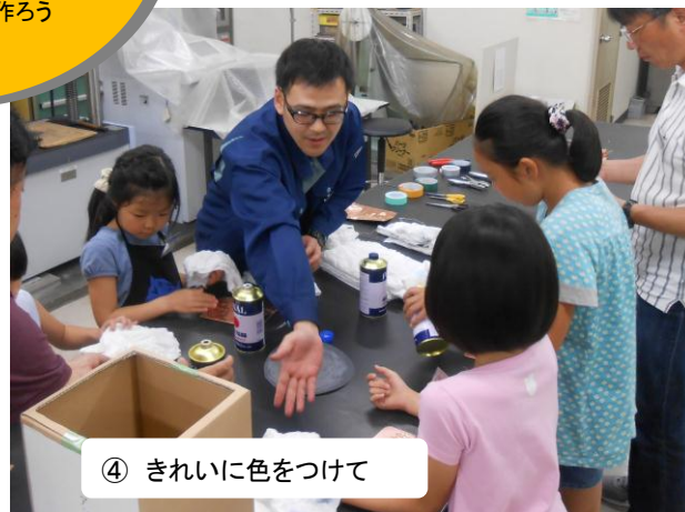
④ きれいに色をつけて