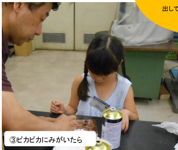
③ピカピカにみがいたら