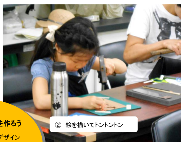
② 絵を描いてトントン