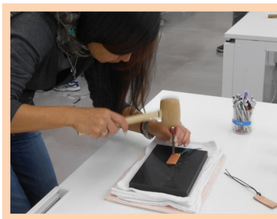
革の刻印キーホルダー作り