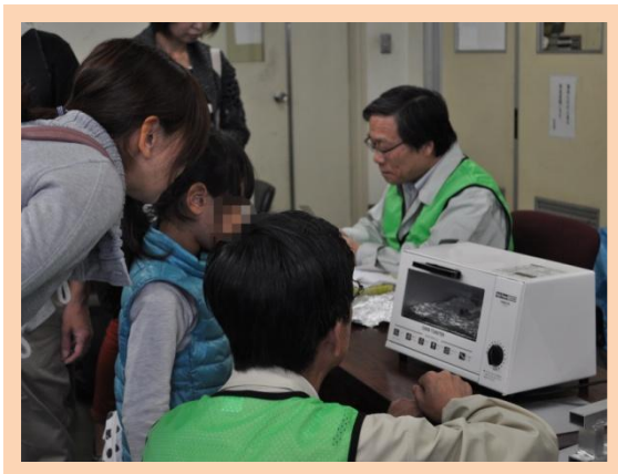
プラ板ストラップ作り