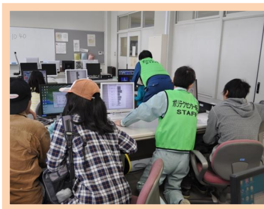
オリジナル名刺&シール作り