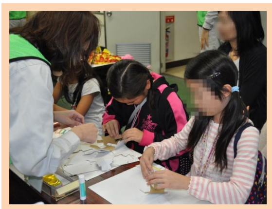
どうぶつ貯金箱作り