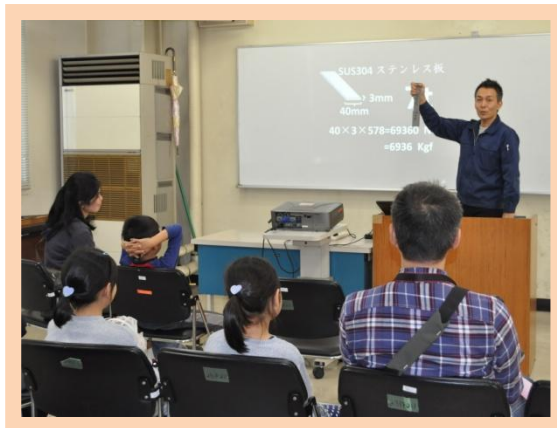
溶接部の強さ (金属の引っ張り試験)