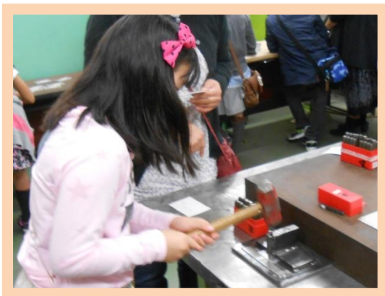
ネームキーホルダー作り