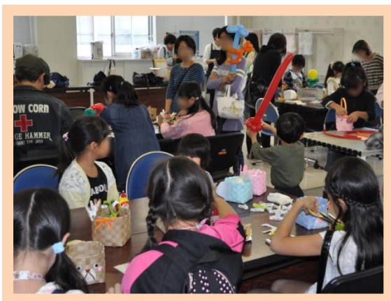
カゴにデコろう！～アニマル編～