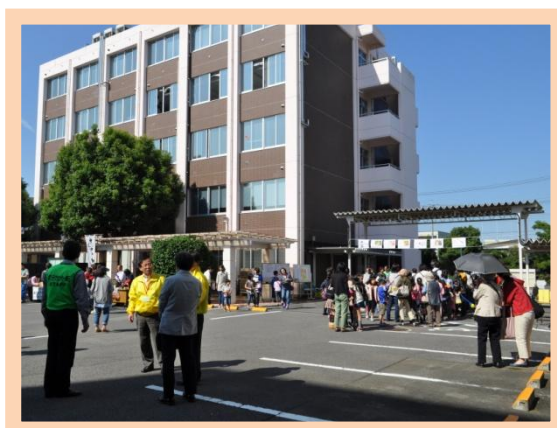
ご来所、有難うございました!