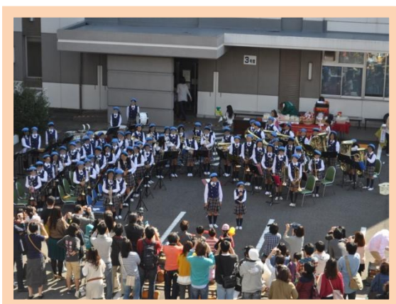
原山小学校金管バンド演奏会