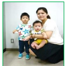
(かわいいお子様と)

子育て中の方も安心して当センターの訓練が受講できるよう、周辺の託児施設を利用し、訓練受講中無料でお子さんを託児施設に預けられるサービスです。さらに職業訓練が受講しやすくなりました。(一定の条件が必要)