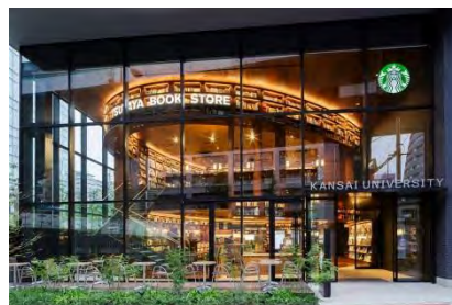
TSUTAYA BOOK STORE 梅田MERISE (実施設計・施工/株式会社船場)

代表者／八嶋 大輔 設立／1962年2月 資本金／223百万円 売上高／25,428百万円 (2018年12月期) 従業員数／428名(2018年12月) 事業所／札幌、仙台、東京、 名古屋、大阪、福岡