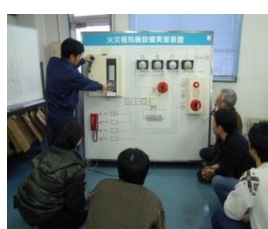
ビル設備サービス科