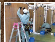
若年者電気設備技術科