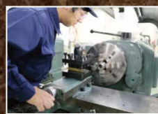
若年者機械加工技術科