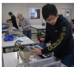
製造ライン技術科