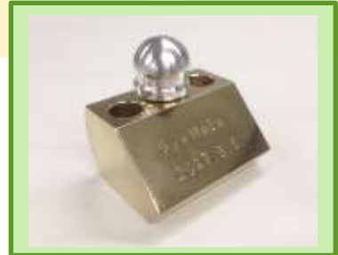
ペーパーウェイト