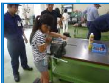
タップによるねじ切り体験