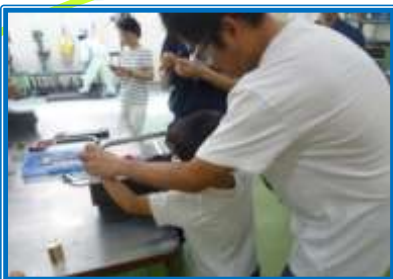
金切のこによる金属の切断体験