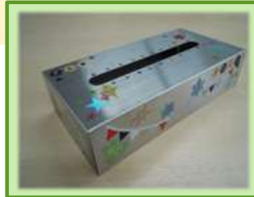
ティッシュケース