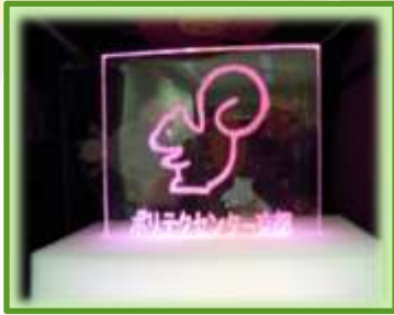
イルミネーション