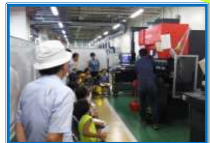
プレスブレーキによる曲げ加工体験