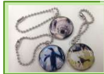
ミニキーホルダー