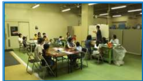
ティッシュケースの製作