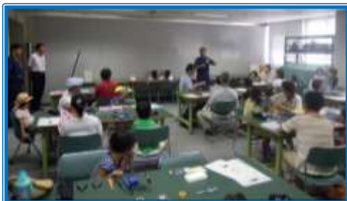
イルミネーションの製作