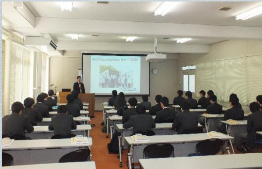
学校説明・施設見学

組込みLinuxマイコンボード（Raspberry Pi）を用いた組込み機器実習