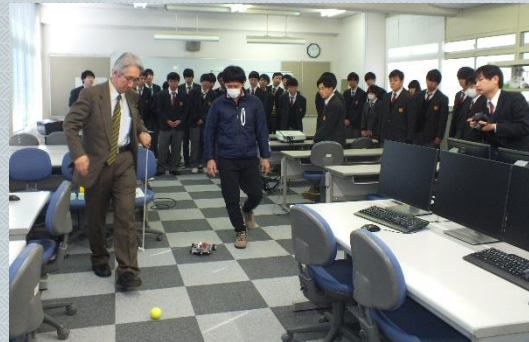
在校生の総合制作の紹介