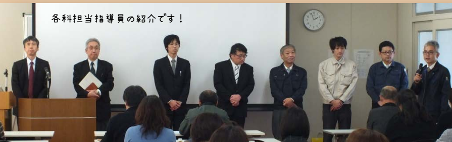
各科担当指導員の紹介です！

キャリアガイダンス室では、心の距離の近い指導を目指しており、いつもで気軽に訪ねて来られる環境でありたいと思っています。