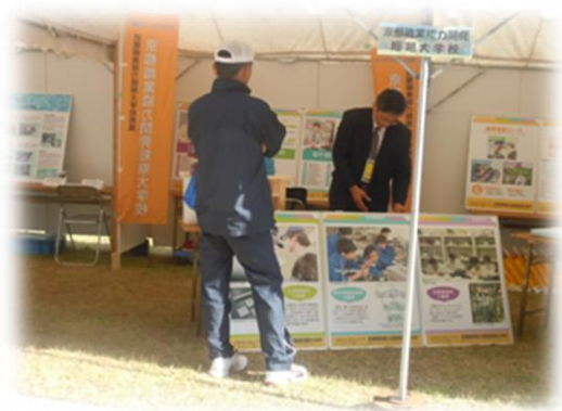
学校紹介パネル展示

また、2 日目においては、ものづくり体験教室として、子供たちを対象とした小椅子の制作を先着 20 人に対して行った。