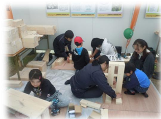
ものづくり体験教室（小椅子の制作）