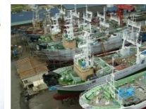
沖合底引き船 上架修繕工事