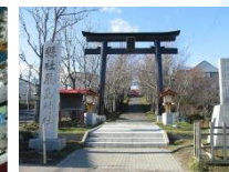
釧路厳島神社 鳥居製作据付