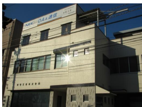
日電工業株式会社