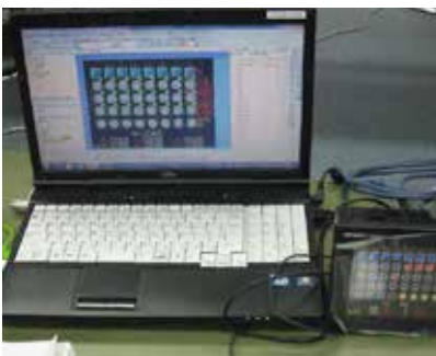
タッチパネル画面作成実習

生産工場のオートメーション化(FA)に必要な知識と技能を習得します。PLC(制御専用コンピュータ)を中心とした配線、制御プログラム(ラダー)、制御盤設計・製作、タッチパネル画面の作成、パソコン通信プログラムの開発(Visual C#)について学びます。