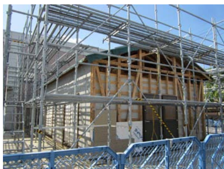
【 模擬家屋 】

4部屋の家屋を実際に建てます。その後、畳と左官壁の和室から、フローリングの洋室へとリフォームを行います。