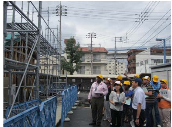
居住系実習場（模擬家屋を建築中）