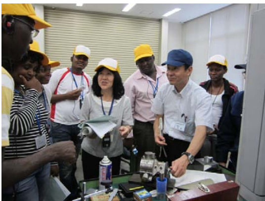
機械加工実習場（NC実習室）

見学後、訪問者の方々からは、 「技術系の訓練に女性も多く参加していることに感銘した。」 「指導員が誇りを持って、仕事している姿を見ることができた。」 「技能を教えているだけではなく、就職へ向けた支援をしていることが分かった。」 などの感想をいただきました。