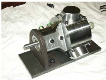
【 エアモーター 】

空気圧にてモータが回転します。訓練最後の課題で、グループに分かれ、図面から加工法や使用工具等を考え、指定期日までに部品加工および組み立て調整を行い、製品として完成させます。