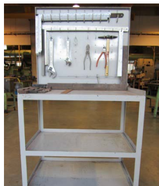
【 工具棚 】

訓練課題の一つとして写真の様な棚を作成します。図面を読み、材料の切断や曲げ、溶接等を行い、金属加工に必要な基礎技術を習得します。