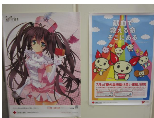
献血啓発ポスター