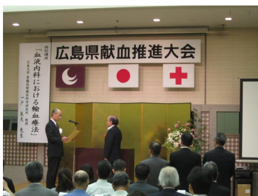
厚生労働大臣感謝状の伝達