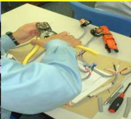
電気制御・CAD技術科