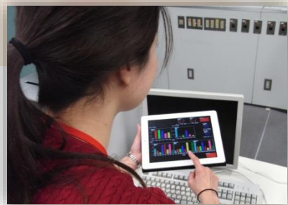
【スマート制御システム科】