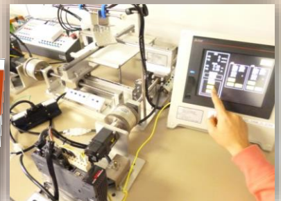
【スマート制御システム科】