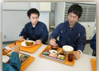
【食堂・休憩スペース完備】