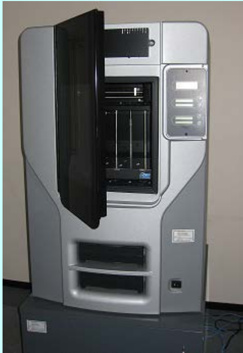
写真1 最新鋭3Dプリンタ