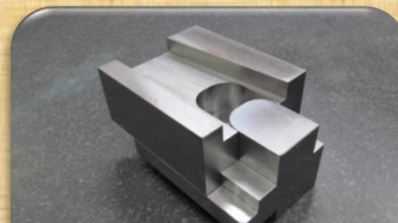
課題：フライス盤2級