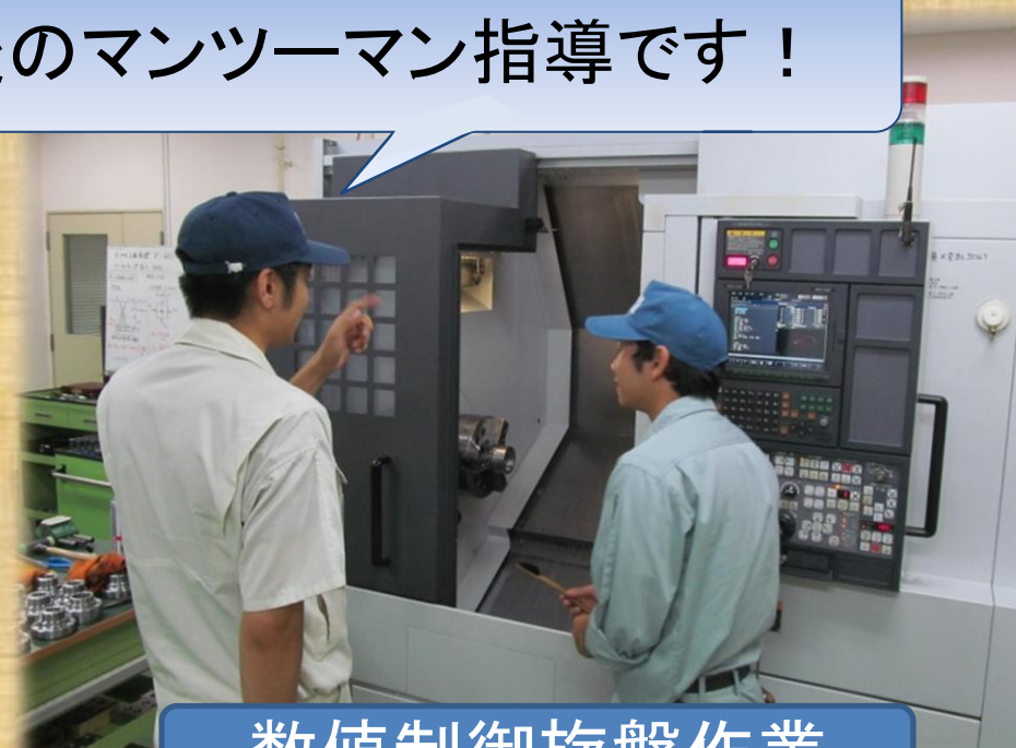
数値制御旋盤作業