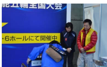
お客様一人一人に「おもてなし」の気持ちで対応