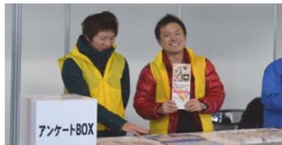
アンケートも集約中