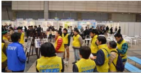
朝のミーティング、エリア責任者の方から当日の仕事について説明を受けています。

11月23日（土）に幕張メッセで第34回全国障害者技能競技大会（アビリンピック）が開催され、千葉校の学生ボランティア12名が大会をサポートしました。また、障害者ワークフェア2013では、電子情報技術科の教員と3名の学生ボランティアが、ステージショーとして親子ものづくり体験教室を実施しました。