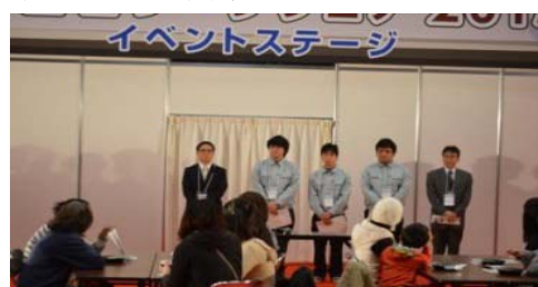
ものづくり体験教室がスタート 「電子オルゴール」を製作します。