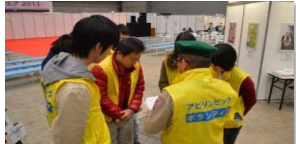
受付担当の学生が打ち合わせ中