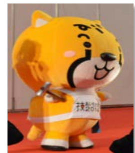
来年の愛知大会をPR 「アイチータ」