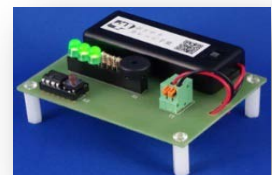
製作した電子オルゴール