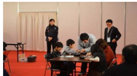
全員が完成し、シングルベルのメロディが流れていました。 参加した子供たちは「ものづくりの楽しさ」を感じたことでしょう。