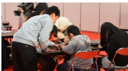
丁寧に指導してます。 部品を一つ一つ組み立てていきます。