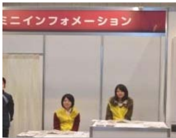
インフォメーションで笑顔の対応