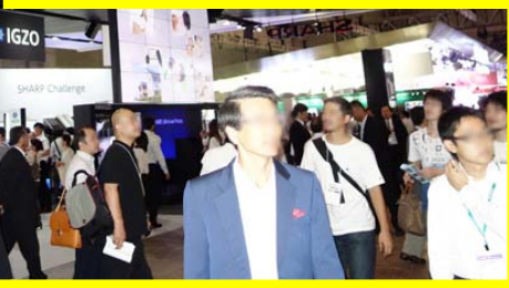
たくさんの人たちで大混雑～(会場風景)