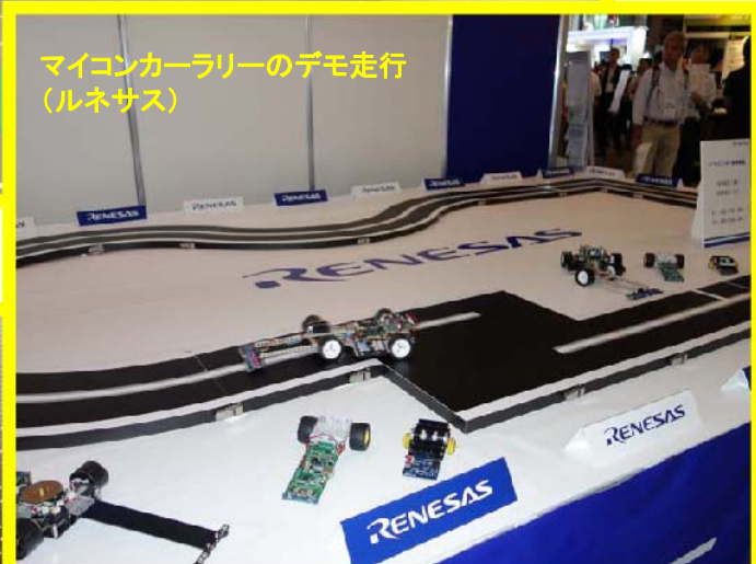
マイコンカーラリーのデモ走行 (ルネサス)