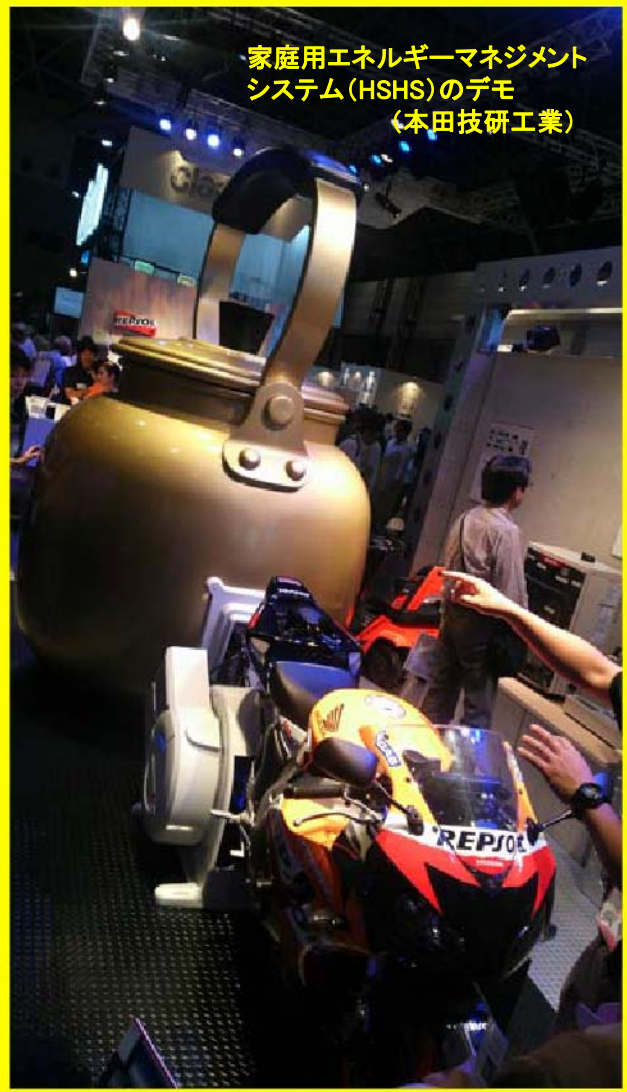
家庭用エネルギー管理 システム(HSHS)のデモ (本田技研工業)