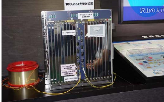
100Gbps の大容量光通信技術 (三菱電機)