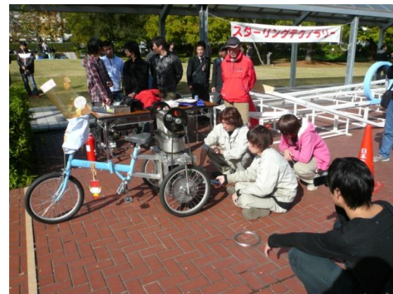
エンジンを過熱しているところ