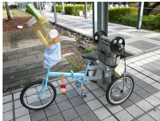
ジェットソルト号