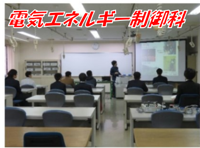
電気エネルギー制御科